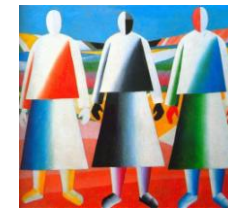
Дівчата у полі. 1932

- К. Малевич – єдиний художник того часу, у творчості якого відобразився Голодомор 1932–1933 рр. На малюнку, виконаному олівцем, Малевич зобразив три фігури, на обличчі яких зображені серп і молот, хрест і труну. Цей малюнок – алюзія на цитату з народної пісні "Де серп і молот, там смерть і голод".