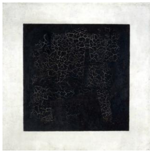
Я всіх покрив чорним квадратом Казимир Малевич