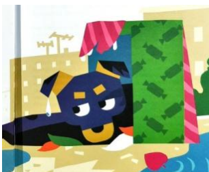
1. "Добрик і його пригоди"

Ведучий пропонує дітям поєднати ілюстрації з відповідними назвами книжок Тетяни Винник.