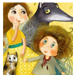
2. "Відлуння нашої хати"